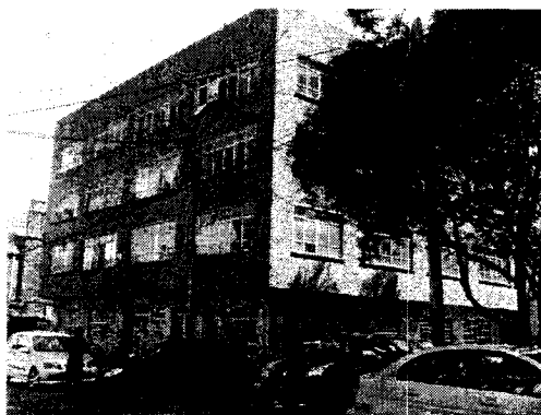
Fotografías de archivo