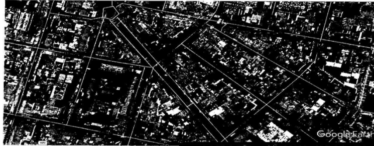
Imagen 1. Localización según coordenadas

Teniendo en cuenta lo anterior se procedió a realizar la evaluación de la estación propuesta con el objetivo de establecer la afectación que la misma generaría a los valores urbanísticos, arquitectónicos y patrimoniales del sector, a través de una matriz que incluye los criterios de evaluación, las variables de análisis y las observaciones sobre aquellos aspectos que se considera pertinente precisar: