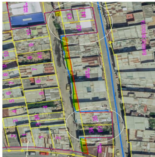
Imagen No. 2 Lindero (Rojo) y loteo (Amarillo) plano desarrollo Bogota II

EVITE ENGAÑOS: Todo trámite ante esta entidad es gratuito, excepto los costos de reproducción de documentos. Verifique su respuesta en la página www.sdp.gov.co link "Estado Trámite". Denuncie en la línea 195 opción 1 cualquier irregularidad.