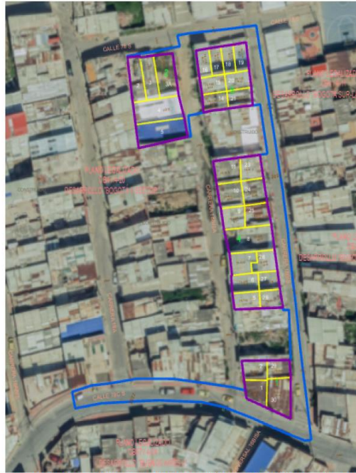
Imagen No. 1 Plano del desarrollo (Lindero azul) Tesoro República de Venezuela B.