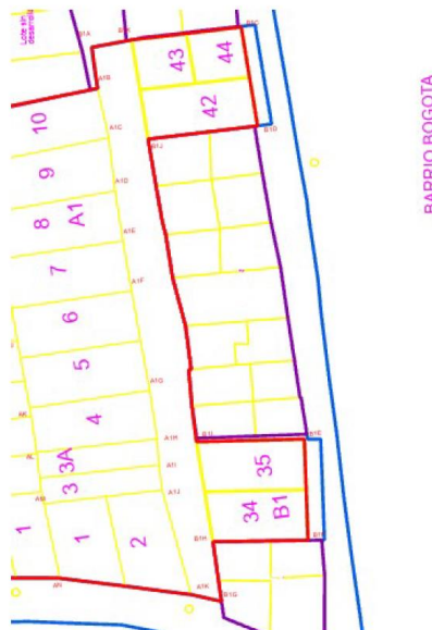
Imagen No. 4 Lindero (Rojo) y lotes 34, 35 42, 43 y 44 AJUSTADOS, plano desarrollo Bogotá II

EVITE ENGAÑOS: Todo trámite ante esta entidad es gratuito, excepto los costos de reproducción de documentos. Verifique su respuesta en la página www.sdp.gov.co link "Estado Trámite". Denuncie en la línea 195 opción 1 cualquier irregularidad.