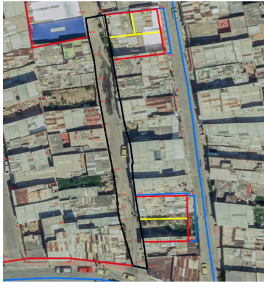
Imagen No. 3 Lindero (Rojo), lotes y vía ajustados del plano desarrollo Bogotá II El lindero azul corresponde a Tesoro Rep. De Venezuela B, con el cual coinciden perfectamente.